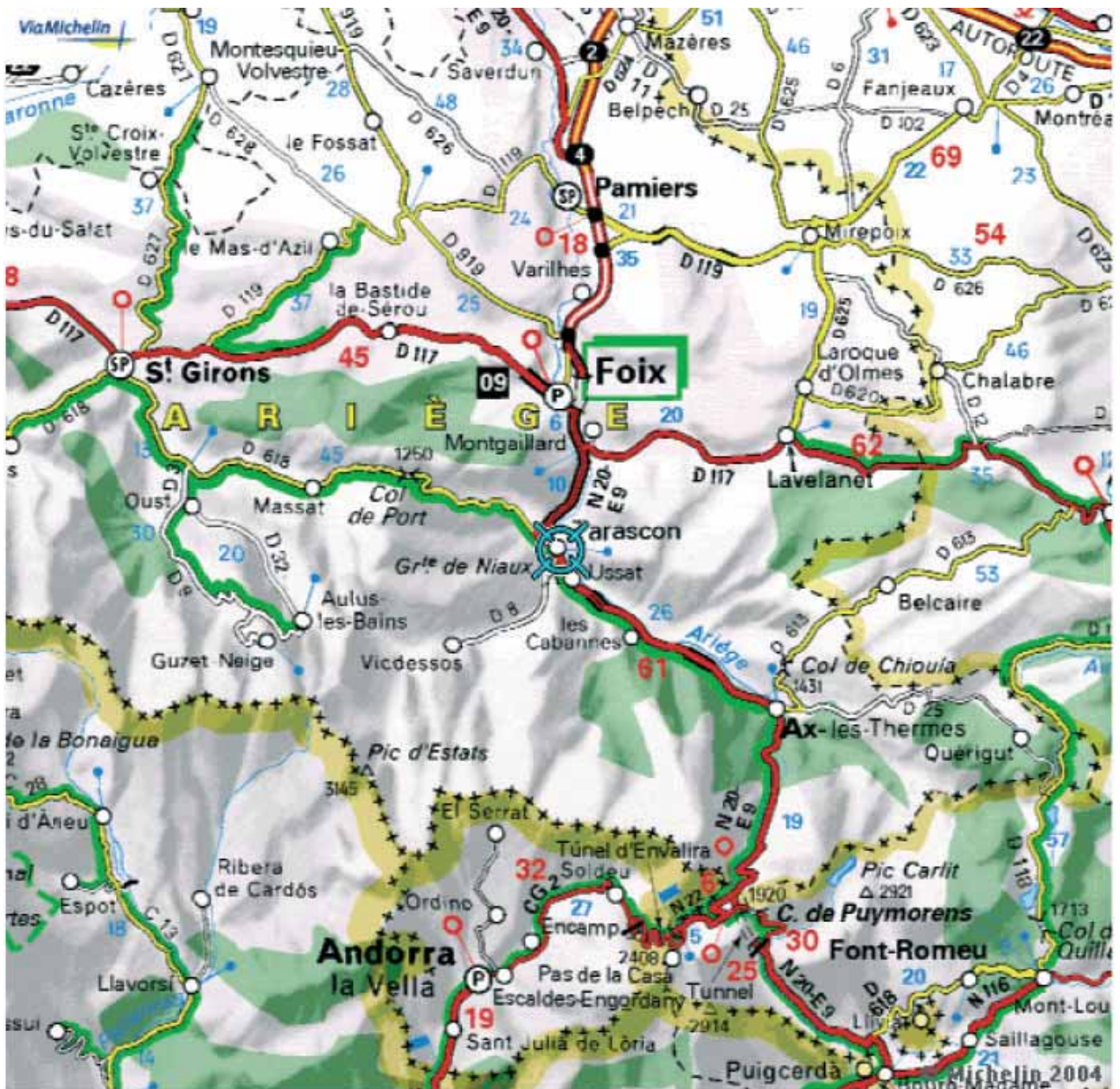
Région des Pyrénées autour de Tarascon sur Ariège